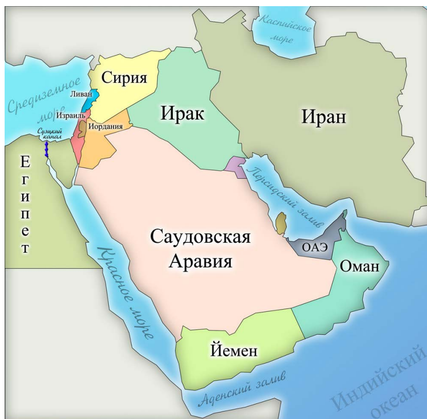
Вспомогательная карта Ближнего Востока с названиями современных государств

В "визитной карточке" места "Ир шалем" написано: под этим именем единственный раз во всём Пятикнижии Моше (Моисея) упоминается город Иерушалаим (Иерусалим). Этот город – столица Израиля, один из древнейших городов мира. Здесь находится гора – гора Мория. Древняя традиция отождествляет Морию с горой в Иерусалиме, на которой - согласно библейскому рассказу - Авраам построил жертвенник и на нём связал своего сына, Ицхака. На этом месте впоследствии царь Давид поставил жертвенник, а царь Шломо (Соломон) возвёл Храм Богу Израиля. Здесь Мечта каждого еврея – увидеть при жизни восстановленный Иерусалим. И это пожелание может быть одним из пожеланий участников этой игры в их "карточках загадываний желаний".