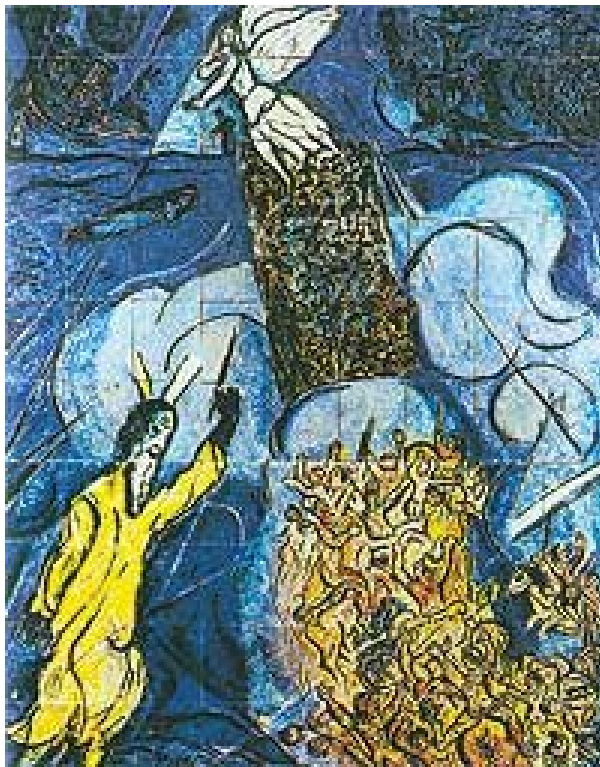
Переход через Красное море. Худ. М.Шагал

http://vokrugsveta.com/S4/po_goram/shamoni.htm