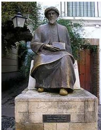
Памятник Рамбаму в еврейском квартале в Кордове, Испания