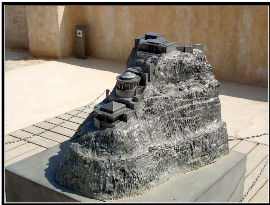
Макет северного дворца Ирода.