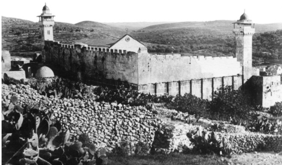
Хеврон в XIX веке