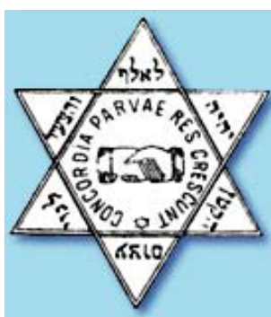
Символ движения Билу