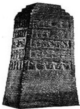
Тиглат-Пальсар III. Каменный рельеф из Нимрода