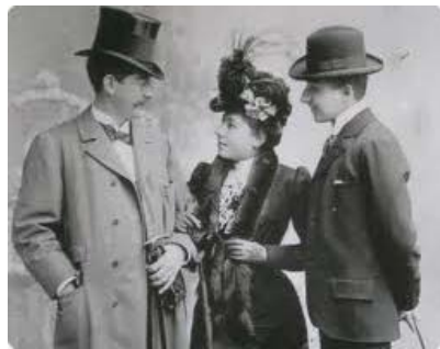
Пражские евреи в конце 19 века