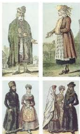
Польские евреи в традиционной одежде