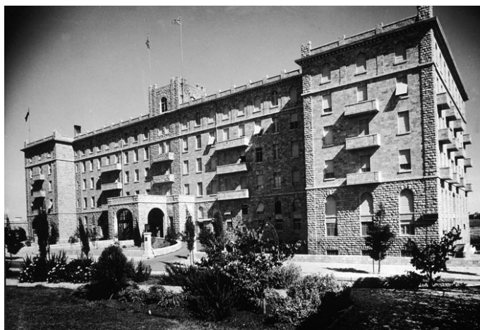
Гостиница "Царь Давид" до взрыва