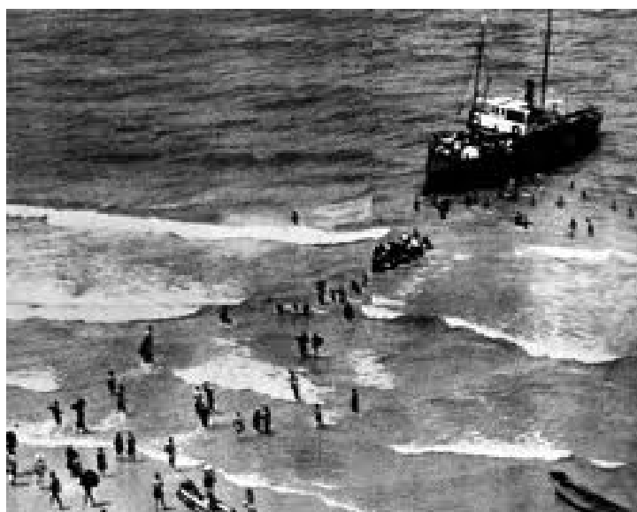
Беженцы достигли берегов Эрец Исраэль