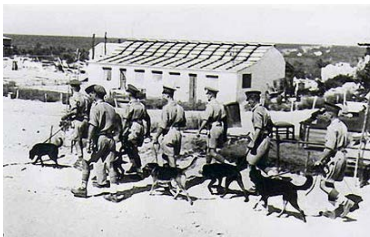
"Чёрная суббота"- английские солдаты с собаками обыскивают киббуц в поисках склада оружия