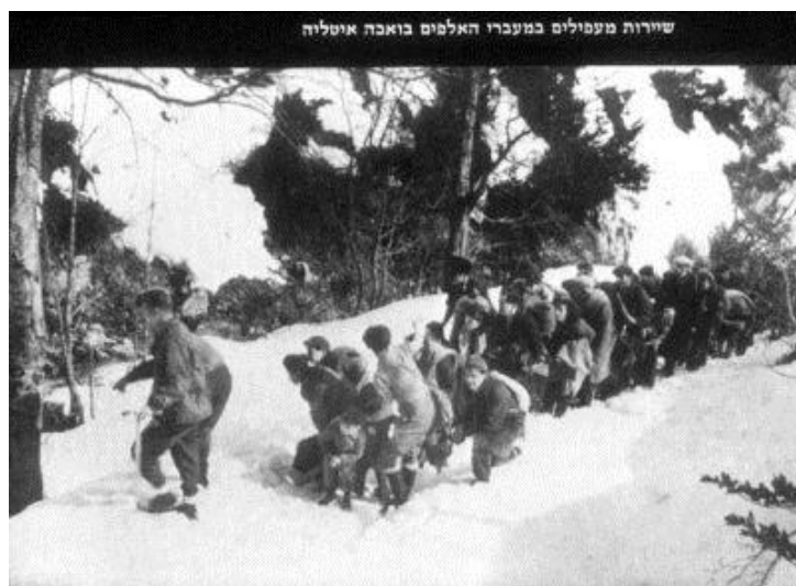
Группа беженцев переходит Альпийские горы