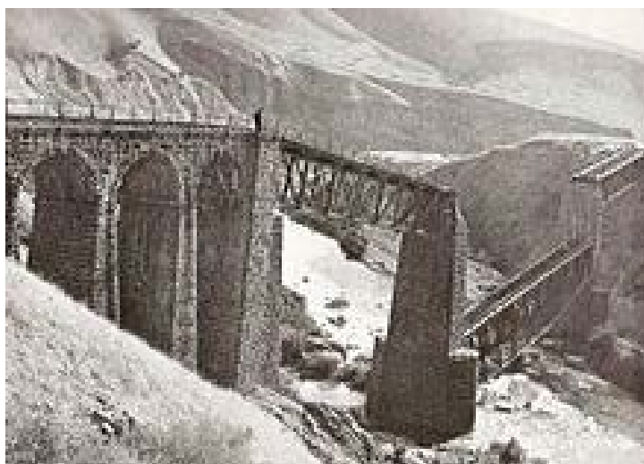
Взорванный мост над рекой Ярмук, соединяющий Заиорданье с побережьем Средиземного моря ("ночь мостов")