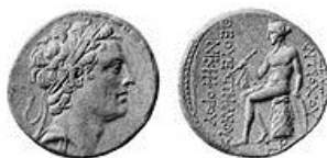
Монета Антиоха IV Эпифана

Название текста: "гонения Антиоха IV Эпифана".