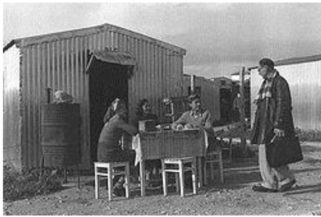
Обеденное время в барачном посёлке