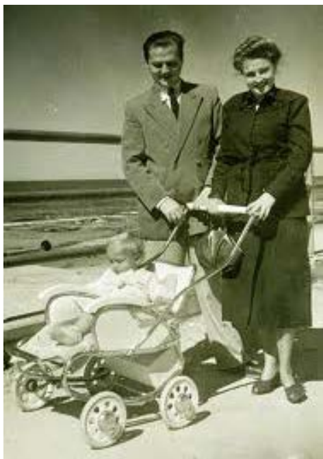
Новоприбывшие из Польши