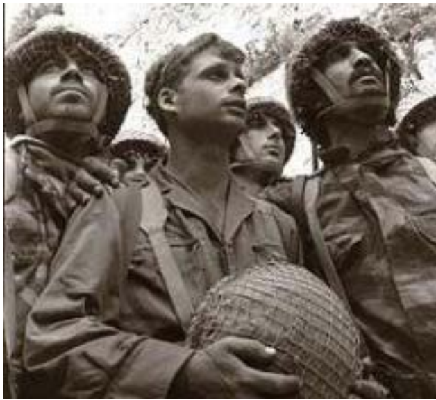
Израильские солдаты у Стены плача в Старом городе