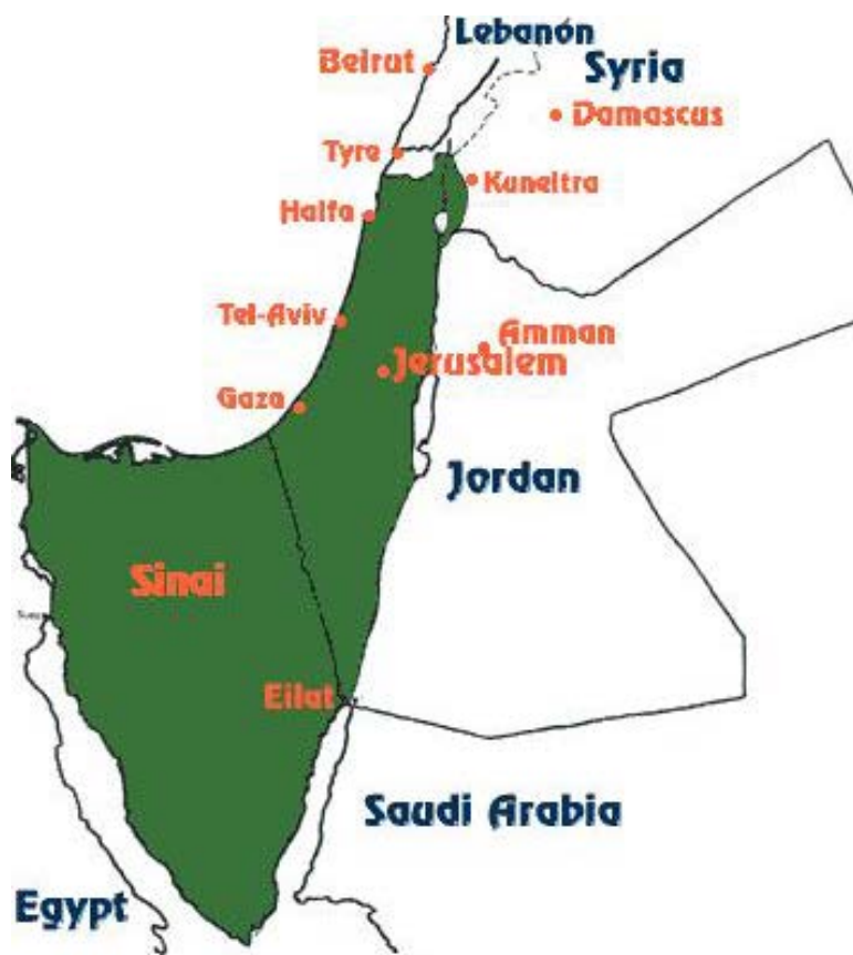
Линия прекращения огня после Шестидневной войны