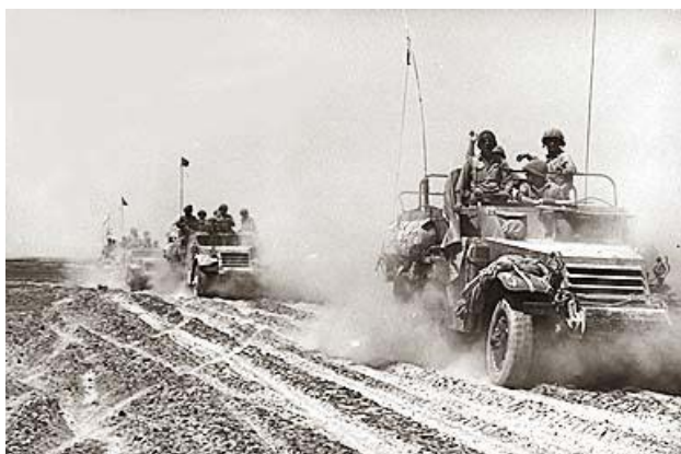
Израильская бронетехника на Синае