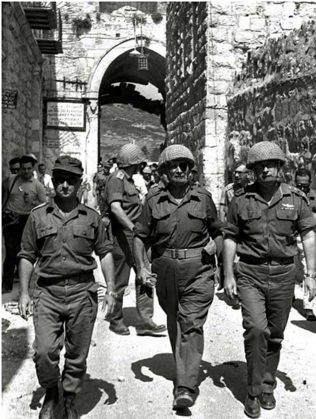
Израильские полководцы в освобождённом Старом городе Иерусалима