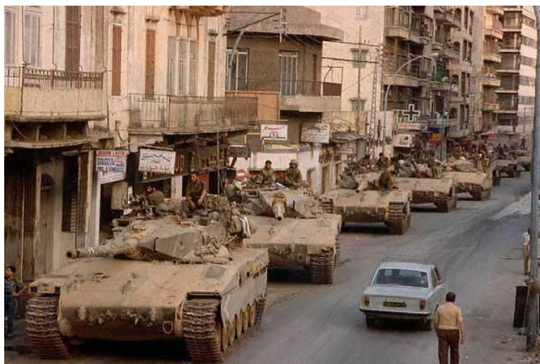
Израильские танки в Бейруте