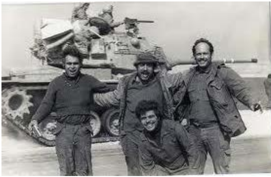
Цахал остановился в нескольких десятках километров от столицы Египта Каира