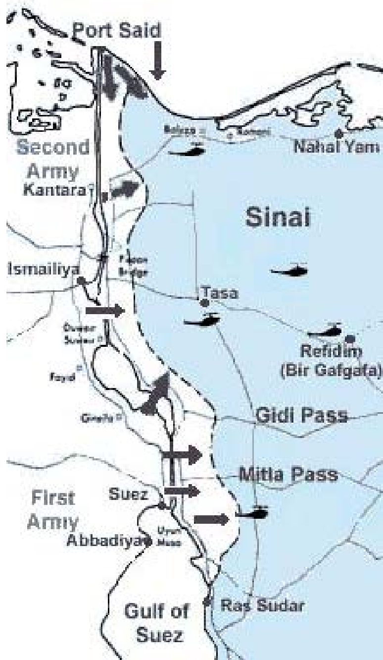
Египетская атака - октябрь 1973