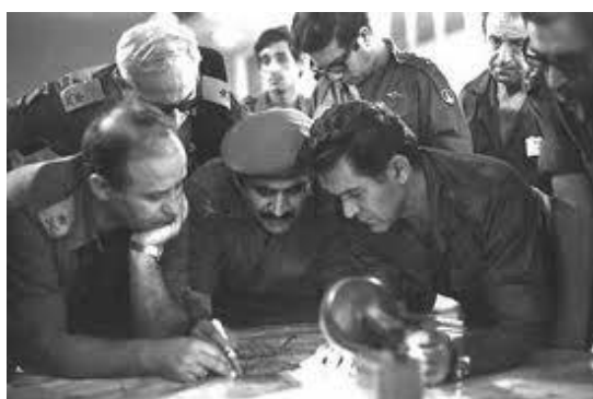
Полководцы Войны Судного дня