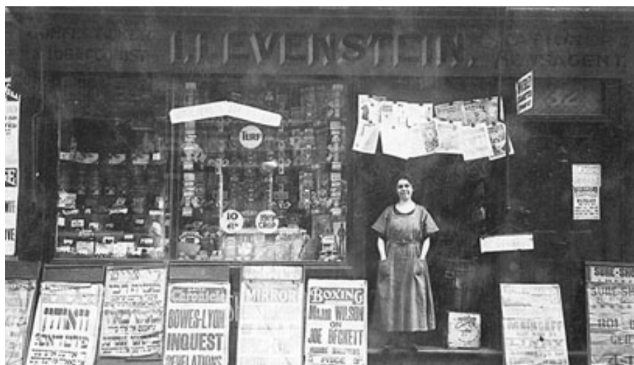
Евреи в районе Ист Энд в Лондоне в начале 20 века