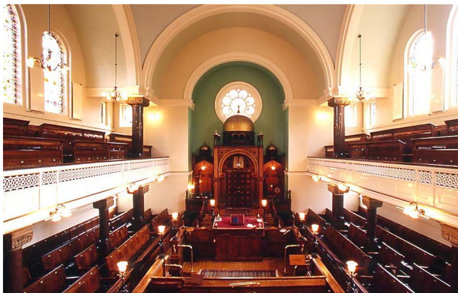
Испанская синагога в Лондоне