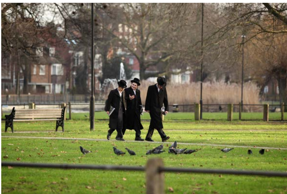
Дети хасидской общины в Лондоне