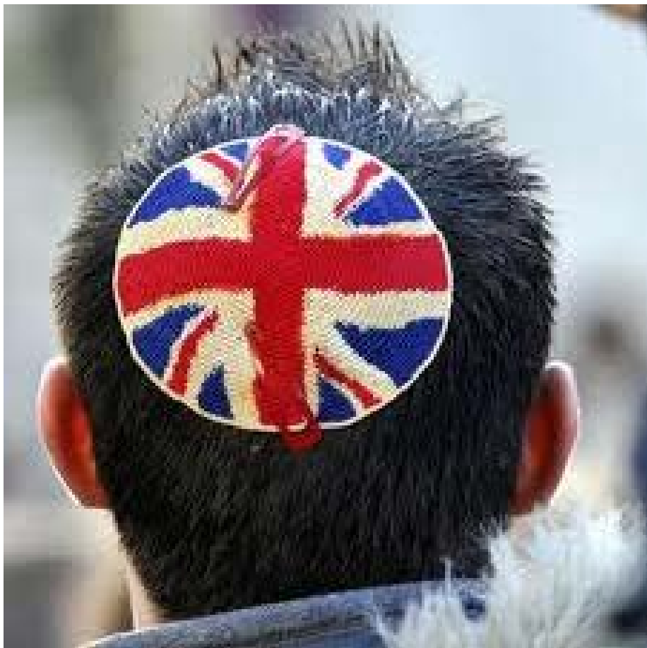
Евреи в конце 20 века в Лондоне